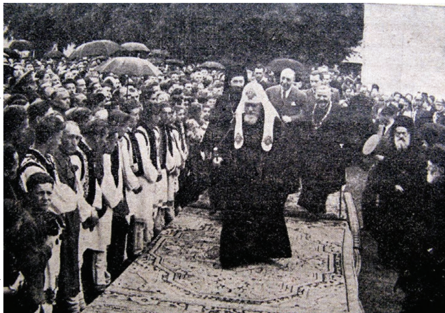
Primirea patriarhului Alexei al Moscovei la catedrala mitropolitană din Suceava